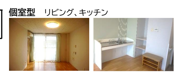
個室型 リビング、キッチン