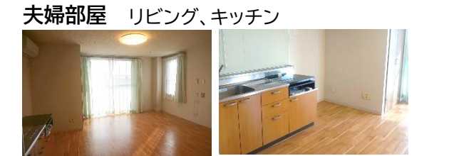
夫婦部屋 リビング、キッチン