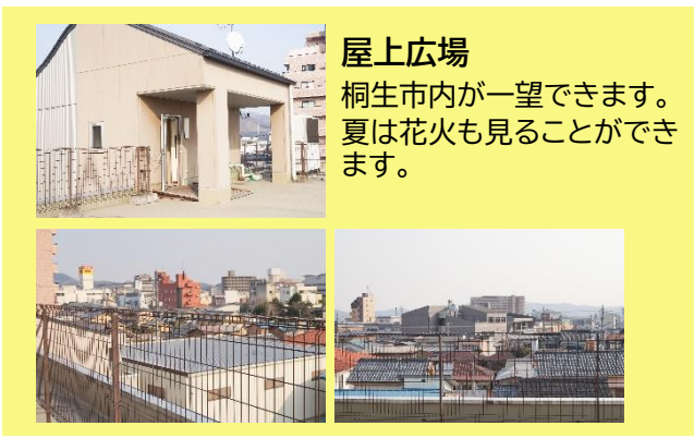
屋上広場 桐生市内が一望できます。夏は花火も見ることができます。