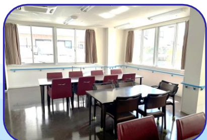
食堂は明るく開放的な空間です。