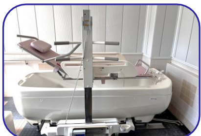
寝たままや座ったままの状態、ゆったり入浴ができます。