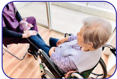
マッサージで体をほぐします。