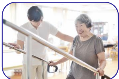
機能訓練で運動療法を行います。